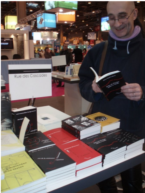
Librairie espagnole 2010