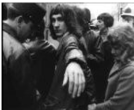
Marc (occupation du siège du CNPF, janvier 1970)